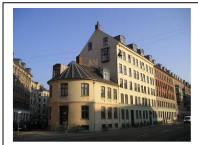
Enghavevej 32, kr. 29.435/m 2 uændret