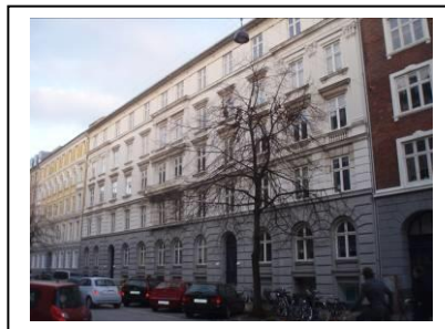
Cort Adellers Gade 5 kr. 10.427/m 2 uændret