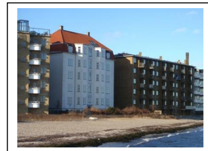
Sundvej 4 kr. 8.087/m 2 hævet 75%