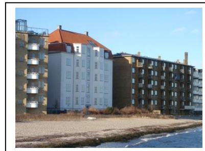
Sundvej 4 kr. 8.087/m 2 hævet 75%