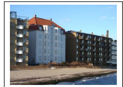
Sundvej 4 kr. 8.087/m 2 hævet 75%